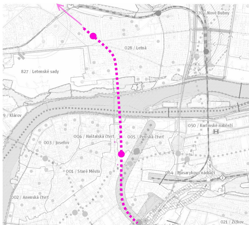
Obr.: Možné trasování linky metra D severně od Náměstí republiky směrem na Letnou s naznačeným výhledovým pokračováním směr Troja a Bohnice.